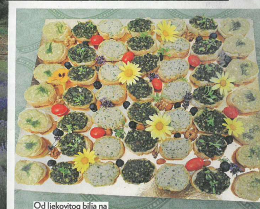
Od ljekovitog bilja na imanju vlasnica spravlja i ukusne namaze te specijalni pesto

N a nekoliko minuta od središta Vodnjana, okružena nasadima lavande i drugog ljekovitog mediteranskog bilja čiji mirisi zamamno lebde u zraku, nalazi se Svijet biljaka, poslovna oaza u kojoj se postupcima parne destilacije i ultrazvučne ekstrakcije proizvode aromaterapijski i kozmetički preparati, dodaci prehrani te preparati opće namjene na bazi organskih eteričnih ulja. - Priroda je najbolji kreator; spojeve koje ona stvori ne mogu se kopirati, odnosno sintetizirati ni u najsofisticiranijim laboratorijima - kaže Mijo Miljak, diplomirani inženjer kemije i specijalist za nuklearno-kemijsko-biološku zaštitu koji je u toj tvrtki od njenog osnutka 2005. Zajedno s vlasnicom Dubravkom Orlić-Bašlin, diplomiranom inženjerkom agronomije iz Pule, razvija proizvode od biljaka iz porodice usnatica koje su bogate antioksidansima: lavande, ružmarina, lovora, čempresa, kadulje, smilja, geranija, matičnjaka i metvice. Antioksidansi su spojevi važni u prevenciji zdravlja: blokiraju slobodne radikale, reguliraju rad metabolizma, kao i razinu šećera te hormona u krvi, analgetici su, a imaju i protuupalna svojstva. Većina sirovine - čak 90 posto - dolazi iz kontroliranog uzgoja s dvadesetak hektara vlastitih polja koja se nalaze na području Vodnjanštine poznatom kao brdo svetog Franje. - U našoj okolici raste više od dvije stotine samoniklih ljekovitih biljaka pa je zabilježeno kako je u vrijeme kuge, koju je u Puli navodno preživjelo samo sedam